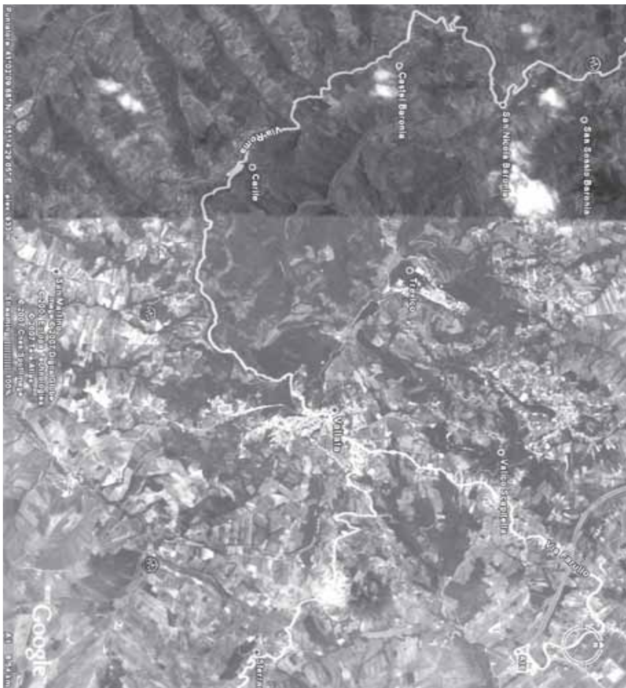
Fig. 3 - Immagine satellitare del territorio del già Circondario di Castelbaronia.